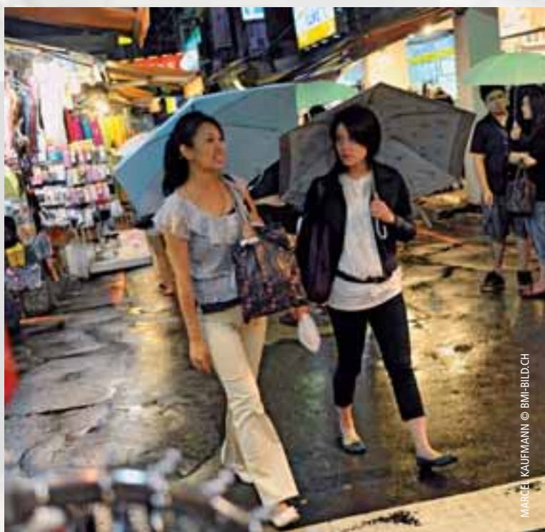
MARCEL KAUFMANN © BMB-BILD.CH