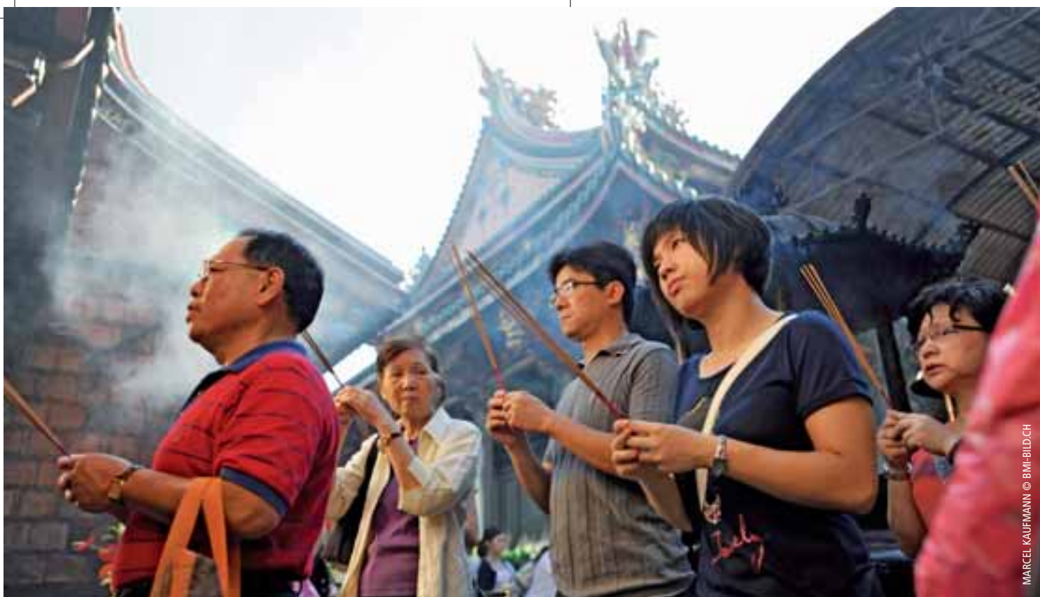
MARCEL KAUFMANN © BMB-BILDCH

La cooperazione nel rispetto delle tradizioni locali, a sostegno di indigeni e lavoratori immigrati